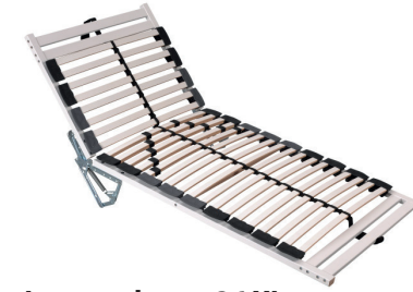
Lattenrahmen 26 XL